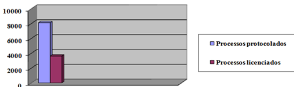
Figura 3 – Representação da quantidade aproximada de processos protocolados e licenciados no ano de 2011 juntos aos órgãos ambientais municipais goianos pesquisados.

Os dados obtidos através das respostas da questão 5 “Quantidade de processos protocolados e licenciados no ano de 2011?”, demonstra a importância da descentralização do licenciamento ambiental para o município, que é comprovando da Figura 3, no sentido em que a transferência do ato de licenciar localmente, descongestiona o órgão estadual, além do que, foi constatado na pesquisa que algumas atividades de menor impacto não eram licenciadas pelo Estado, devido à distância geográfica entre o órgão e o local da atividade, e a pouca quantidade de servidores na SEMARH.