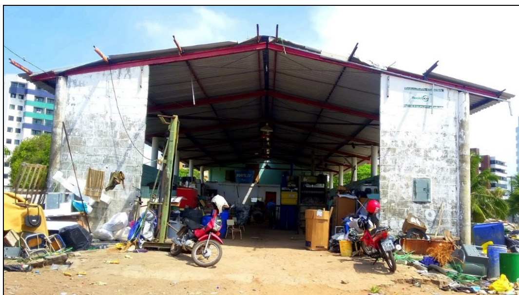
Figura 1: Galpão da ASCARE – JP, polo Bessa.