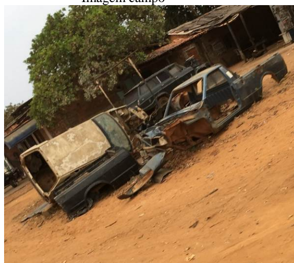
Figura 11 - Sucatas que podem acumular água e servir de abrigo para o mosquito.

O presente estudo vem mostrando que o uso do equipamento pode vir a ser uma ferramenta muito útil para o método de visita dos agentes de endemias. Isso porque há a otimização de todo o processo de inspeção dos imóveis.