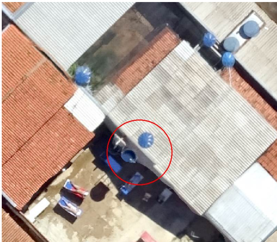
Figura 9 - Caixa d'água destampadas

geralmente não são percebidos pelo agente de endemias que faz visita no local e se tornam um potencial criadouro do mosquito.