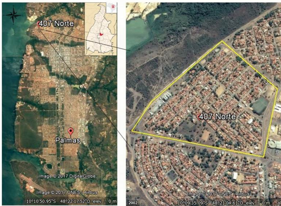
Figura 1 - Município de Palmas – TO (a) Quadra 407 Norte (b).

A escolha da quadra 407 Norte se deu depois de dados disponibilizados pela Secretaria de Saúde do município (SEMUS) e o Centro de Controle de Zoonoses de Palmas – TO (CCZ), onde foi fornecida uma relação mensal dos primeiros meses do ano de 2017 e escolhido o mês de fevereiro de 2017, tendo em vista que o mosquito Aedes necessita de água para se reproduzir, o mês selecionado registrou precipitações acima da média na capital. A tabela 1 mostra detalhadamente os dados que foram obtidos através de visitas realizadas pelos os agentes de endemias do CCZ.