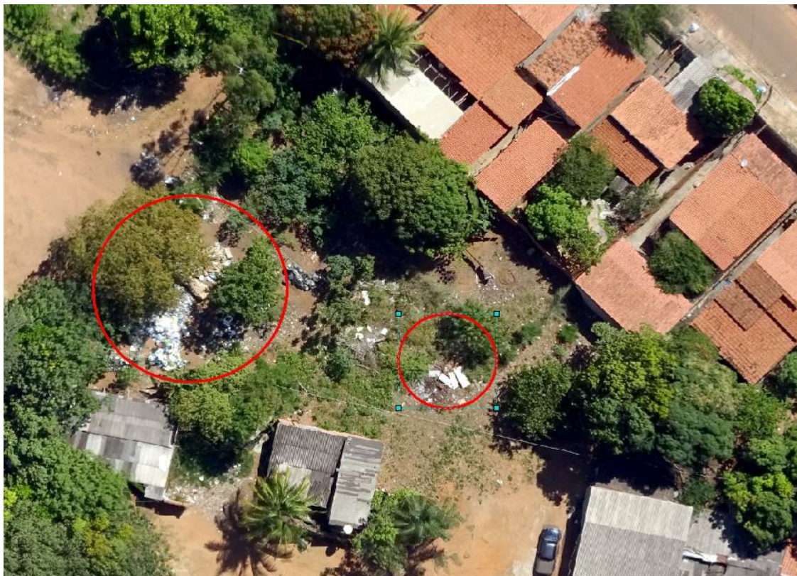
Figura 7 - Lote com disposição inadequada

Como citado anteriormente, a utilização do VANT pode auxiliar na disposição inadequada do lixo. Na quadra em estudo é possível encontrar resíduos sólidos depositado a céu aberto, principalmente em terrenos baldios, gerando assim grandes transtornos sociais, ambientais e podendo gerar graves problemas de saúde para a população. Nota-se que o serviço de coleta é oferecido regularmente na quadra, porém a população não faz a sua parte, que é acondicionar o lixo em sacos plásticos e dispor nos locais apropriados. Na área de estudo nota-se vários entulhos espalhados pela quadra e vários resíduos que não tem uma destinação adequada conforme a Figura 8.