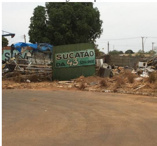
Figura 10 - Empreendimento Sucatão da 43, potencial abrigo do mosquito.

A Figura 11 mostra na quadra sucatas de carro, estes locais podem vir a ser um criadouro do mosquito, principalmente em épocas chuvosas onde é mais favorável para a proliferação do mosquito Aedes aegypti , estas sucatas podem acumular água e acabam oferecendo ambientes propícios para o depósito de ovos do mosquito. Portanto é importante o monitoramento destes locais e se possível a retirada destas sucatas, para que não possam vir servir de abrigo para o mosquito.