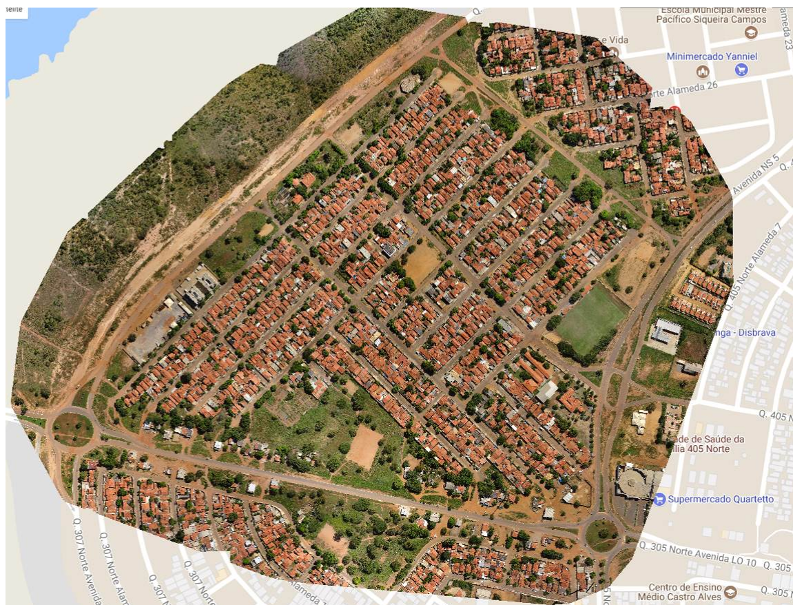
Figura 5 - Mapa produzido pelo software Postflight Terra 3D a partir das 247 imagens obtidas no voo da quadra 407 Norte em Palmas-TO.

Por meio de uma câmera, o VANT faz imagens aéreas em alta resolução, evidenciando o que não é possível avistar no solo, o que permite o mapeamento dos locais de possíveis focos. Após a elaboração do mapa, é realizado uma análise com o objetivo de identificar os pontos de possível foco do mosquito. Analisando o mapa de forma minuciosa, verificou-se 32 locais que possam vir a ser criadouro do mosquito Aedes aegypti . Estes locais foram identificados com um ponto verde, conforme ilustrado na Figura 6.