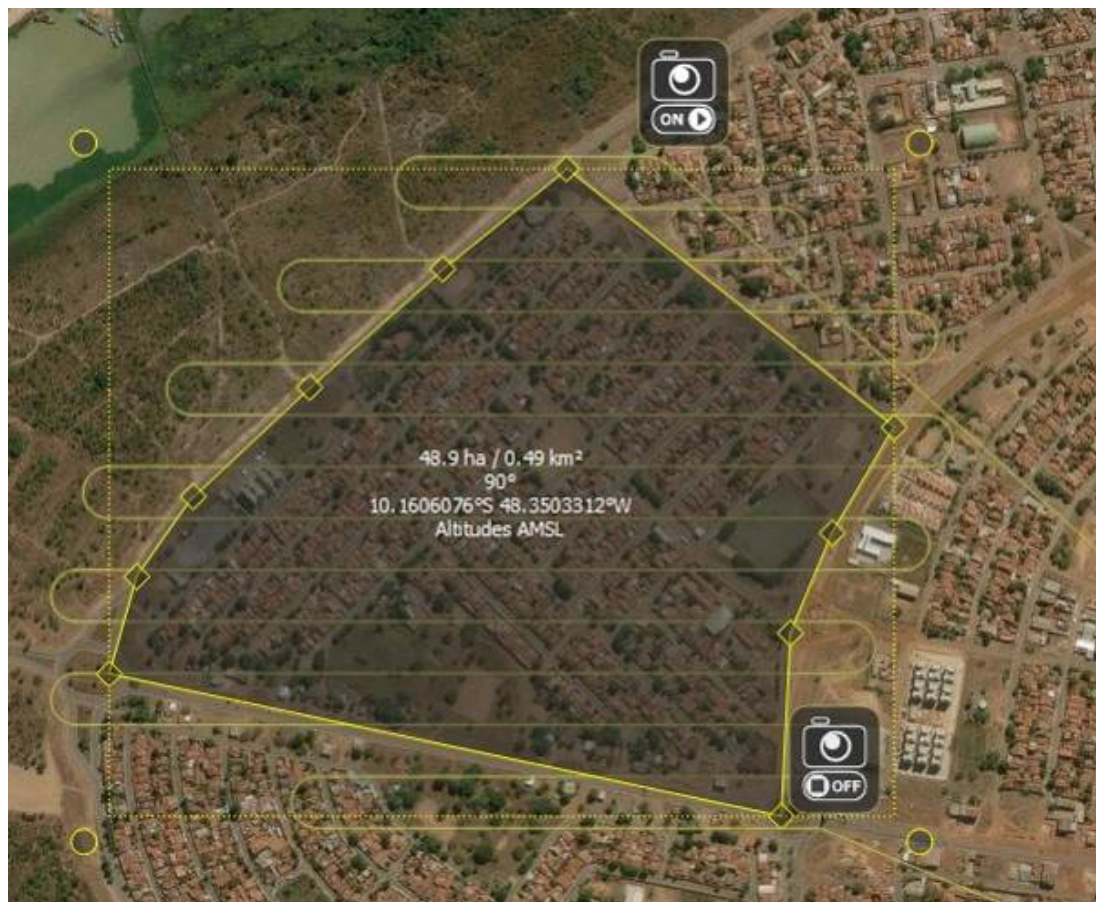
Figura 4 - Plano de Voo no Software eMotion2 da quadra 407 Norte

Após a captura das imagens o programa eMotion2 irá fazer todo o processo de georreferenciamento no próprio software de planejamento de voo, o programa utiliza as coordenadas obtidas pelo próprio VANT e em seguida o software Postflight Terra 3D é o responsável por produzir um mosaico ortorretificado, ou seja, uma junção de todas as 247 fotos obtidas no voo, totalizando uma área de 0.49 km².