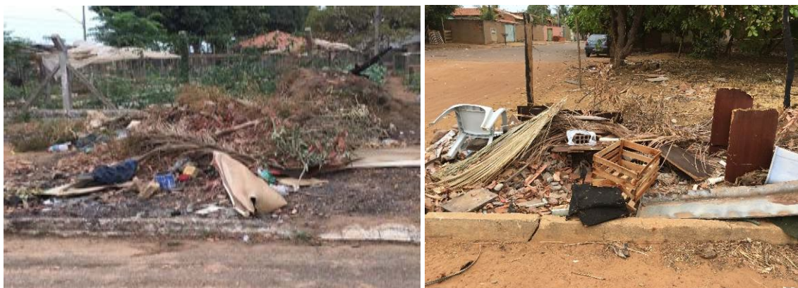
Figura 8 - Margens de ruas utilizadas para a disposição inadequada do lixo.

Como citado anteriormente, a utilização do VANT pode auxiliar na disposição inadequada do lixo. Na quadra em estudo é possível encontrar resíduos sólidos depositado a céu aberto, principalmente em terrenos baldios, gerando assim grandes transtornos sociais, ambientais e podendo gerar graves problemas de saúde para a população. Nota-se que o serviço de coleta é oferecido regularmente na quadra, porém a população não faz a sua parte, que é acondicionar o lixo em sacos plásticos e dispor nos locais apropriados. Na área de estudo nota-se vários entulhos espalhados pela quadra e vários resíduos que não tem uma destinação adequada conforme a Figura 8.