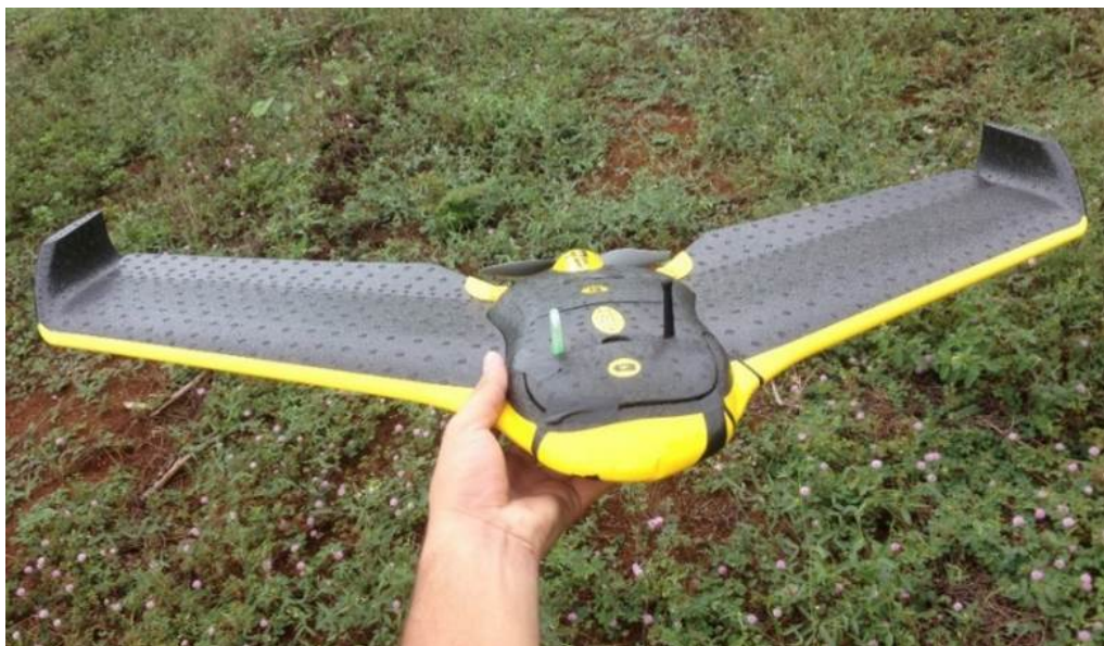
Figura 2 - VANT utilizado na pesquisa - eBee da SenseFly.

O VANT utilizado na pesquisa, o modelo eBee da empresa Suíça Sensefly ilustrado na Figura 2, é uma aeronave bastante segura e eficiente. Possui inteligência artificial para realizar a decolagem, voo e a aterrissagem automaticamente, o que acaba trazendo bastante segurança para o processo. Além disso permite realizar a tomada de fotos de forma rápida e sob demanda. As imagens são capturadas durante o voo de forma a garantir a sobreposição necessária à cobertura da área delimitada em plano.