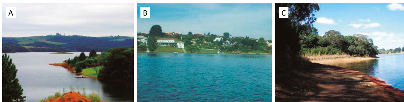
Fonte: A - Ibiúna (2009); B - São Paulo (2009a); C - Marcicano (2008).

A enquete com os educandos iniciou-se com a apresentação de imagens associadas à represa Itupararanga, que representa um landmark , ou seja, um marco estrutural da paisagem (MAROTI et al. , 2000), considerado um ponto de referência associado a essa UC. As imagens (Figura 2) representam áreas utilizadas para lazer (pesca recreativa, banho e prática de esportes aquáticos), bem como características marcantes da paisagem, como vegetação, áreas de cultivo e construções residenciais. O uso de imagens favorece a evocação de percepções ambientais, uma vez que o estímulo visual permite o resgate de conexões construídas com a paisagem a partir de experiências vivenciadas (LÓPEZ-SANTIAGO et al. , 2014). Assim, buscou-se veri-