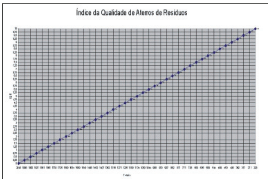
Figura 2 – Curva de tendência de regressão linear do IQR reformulado