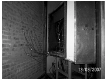
Figura 1a. Parede sendo ensaiada na caixa quente protegida.