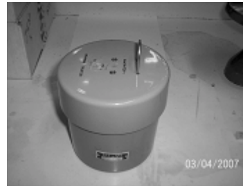
Figura 1b. Calorímetro.