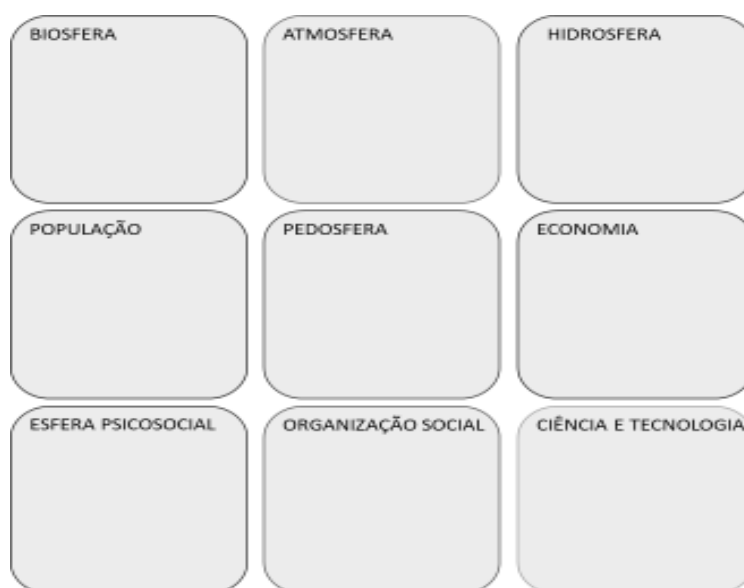
Figura 1 - Esferas referenciadas pela metodologia

Para cada um dos temas, propuseram-se a discussão sobre sintomas das síndromes que se manifestam em nove esferas elencadas a partir de experiências anteriores de aplicação da metodologia, suficientes para a discussão inicial e não fechadas a inclusão de novas. O passo seguinte foi encontrar relações de causalidade entre os sintomas e a circularidade com que ocorrem. A Figura 1 apresenta o esquema gráfico das esferas utilizado.