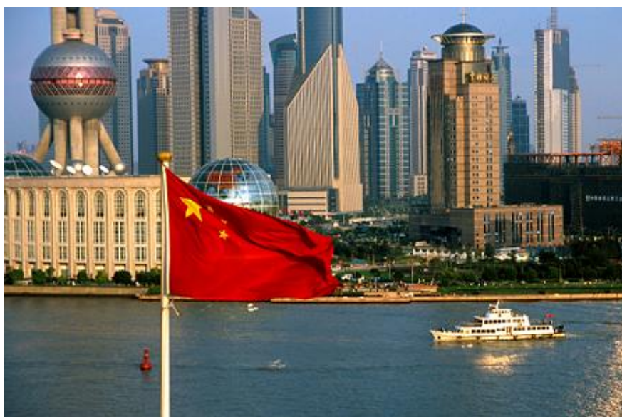
Figura 5: Cidade de Pequim