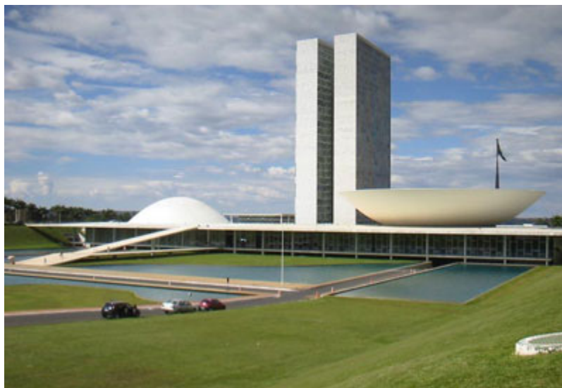
Figura 3: Congresso Nacional de Brasília

visitas de campo e comunicação verbal com os responsáveis pela construção do estádio.