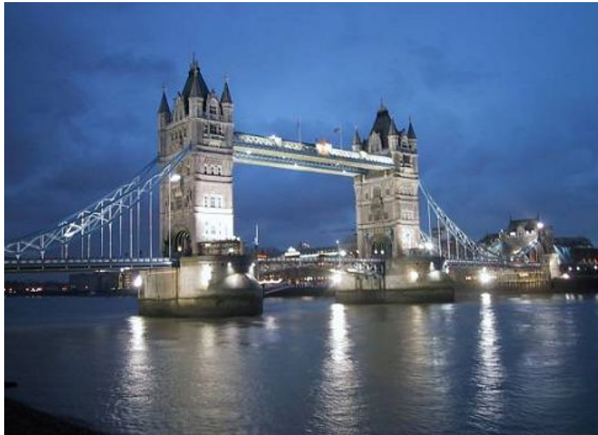
Figura 4: Tower Bridge, Londres