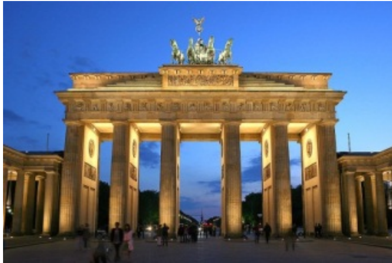
Figura 6: Portão de Brandemburgo, Berlim