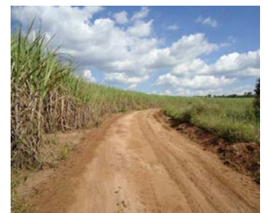
Figura 2 – Motoniveladora em operação na área de estudo e de um carreador após a sua passagem.