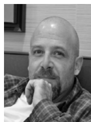
Tadeu F. Malheiros (Editor Convidado)