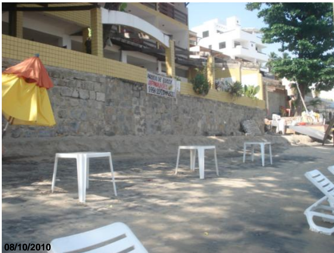
Figura 6: Imóvel comercial construído ao lado do Morro do Careca.

Ao longo de todo o percurso, considerando a maré baixa, pode ser visto que algumas as bocas de lobo não apresentaram um comprometimento aparente em sua estrutura, no entanto as mesmas, quando em maré alta, são atingidas. Além disso, observou-se que algumas galerias da drenagem pluvial possuem ligações clandestinas de esgoto e problemas relacionados à erosão pluvial ou marinha.