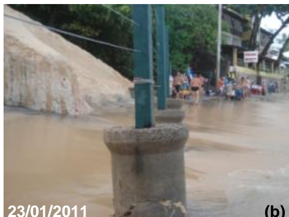
Figura 42: Cerca de obstrução de acesso ao morro.

Na figura 5 evidencia-se o comprometimento de algumas estruturas como galerias de drenagem, poços de visita do sistema de público de coleta de esgotos e acessos a imóveis mesmo para o cenário atual (zero elevação).