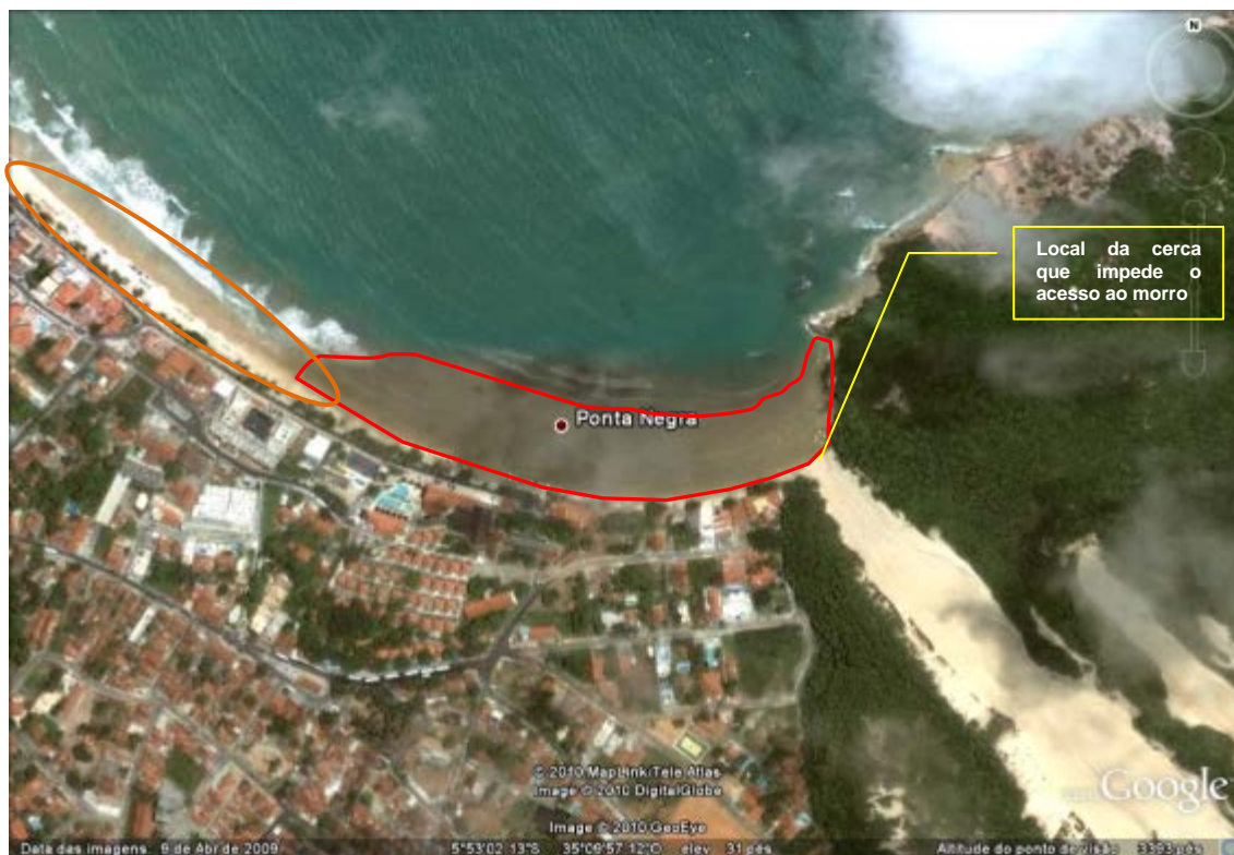
Figura 3: Semi baía da praia de Ponta Negra. Vista aérea do Morro do Careca.

Para o cenário zero (atualmente), iniciando a análise a partir do Morro do Careca, observa-se que este tem o acesso totalmente impedido quando em maré cheia e os imóveis mais próximos a duna quase não possui faixa de areia o que os tornam mais vulneráveis a dinâmica oceânica. A figura 3 apresenta a vista aérea do Morro do Careca, a sua frente em destaque com polígono vermelho, uma faixa de areia de cor escurecida a qual fica exposta em maré baixa e quando em alta apresenta-se totalmente inundada, a água chega a atingir o pé do morro e dessa forma o acesso ao local fica impedido. A área à esquerda com destaque laranja mostra uma mudança na conformação da praia. Nesse local é possível observar uma berma suave e uma faixa de areia bem pequena que não é inundada na maré alta.