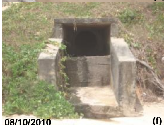
Figura 73: Nas fotos (a, f) é observado que existem ligações clandestinas de esgotos nas galerias de drenagem. Nas demais fotos o que é verificado é o possível avanço do mar em direção as galerias aportando sedimentos que obstruem a passagem das águas

Nesse mesmo trajeto também foi observado problemas de erosão marinha e pluvial nas obras de drenagem, calçadão e acesso à praia. A remoção dos sedimentos provocada pela ação dos ventos e/ou pela dinâmica das marés desestabilizam as estruturas de modo a deixá-las suscetíveis a colapsos provocando perda das estruturas de acesso à praia, por exemplo. Tal situação provoca ações imediatistas na tentativa de contenção da integridade da estrutura podendo surtir pouco ou nenhum efeito.