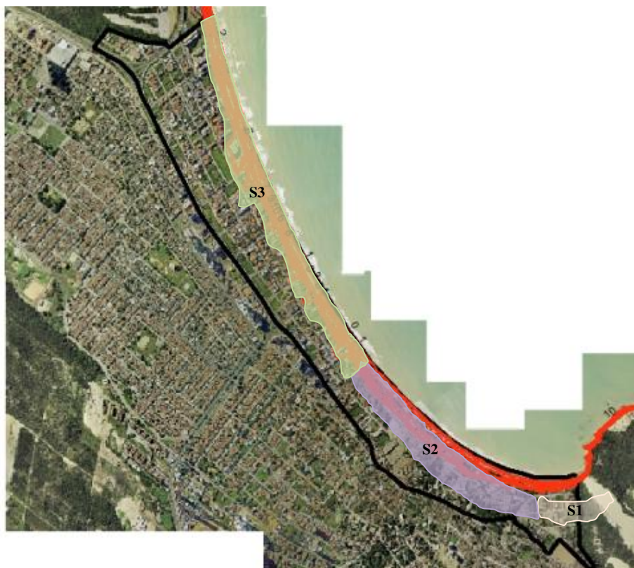
Figura 2: Vista aérea da Praia de Ponta Negra onde pode ser observada a área de estudo e suas subdivisões.

Tomando por base todos os estudos já existentes, a preocupação com os riscos inerentes a zona costeira e considerando a importância do bairro de Ponta Negra para o município do Natal, foram elaborados 11 cenários de inundação provocada pela elevação do nível médio do mar ao longo dos 4,0 Km da Praia de Ponta Negra. Considerando a extensão do trecho e para uma descrição mais criteriosa achou-se necessário dividi-lo em 03 partes (figura 2) sendo a primeira (S1) compreendida entre a base do Morro do Careca e o início do calçadão que aqui será denominada o ponto zero da avenida Erivam França, a segunda (S2) abrangendo toda a Avenida Erivam França e a terceira (S3) composta pelo espaço entre o final da avenida citada anteriormente e o início da Via Costeira. Para a fragmentação utilizou-se como parâmetro as características físicas, o uso e ocupação do espaço urbano e a atividade econômica desenvolvida. Segue a apresentação de cada sub-trecho com suas particularidades.