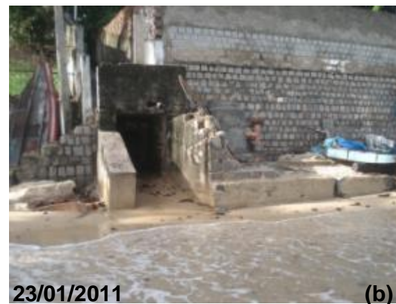
Figura 5: Exemplos de estruturas de drenagem comprometidas.

O imóvel observado na figura 6 foi construído bem do lado do Morro do Careca, ou seja, muito próximo da área de inundação em maré alta e no pé de uma duna. Por esse motivo foi instalado o muro de arrimo que para esse caso serve para conter a pressão da duna e a força das ondas que possam alcançá-lo. É nessa área que é visualizado o início da berma.