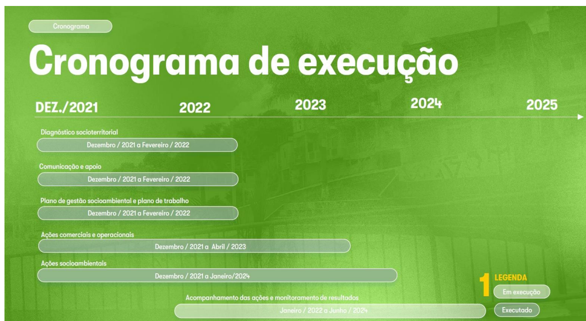
Figura 2: Planejamento para execução do contrato de performance para aumento do volume micromedido de água

Concluídas as etapas de contratação, o consórcio vencedor apresentou plano de trabalho contemplando as atividades, distribuídas nos 42 meses de vigência do contrato de performance. No plano estavam contidas ações preliminares às intervenções para a regularização ou reativação das ligações, que tinham por objetivo divulgar o objetivo das ações, mobilizar e obter a adesão dos moradores, na medida em que divulgam os benefícios para a população local. O planejamento do contrato está detalhado na imagem 2, extraída dos documentos apresentados pelo consórcio contratado: