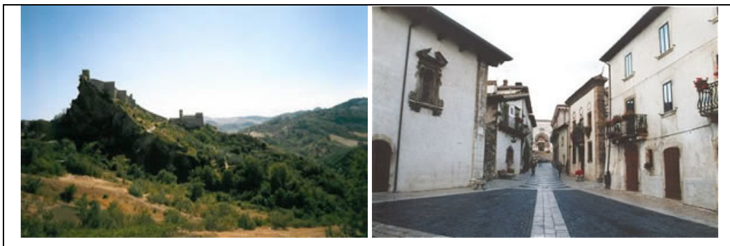
Fig.2: Região de Abruzzo - Itália.

O Abruzzo tem 150 km de costa com características peculiares: a costa Teramo, de Martinsicuro a Silvi Marina, muito urbanizada e com uma grande oferta de serviços e hospedagens de alto nível muito frequentadas por clientes internacionais, o cenário é baixo e retilíneo, com praias amplas e arenosas. Ao sul o cenário muda: de Ortona a Vasto e San Salvo é silvestre, com praias marcadas por uma densa vegetação mediterrânea.