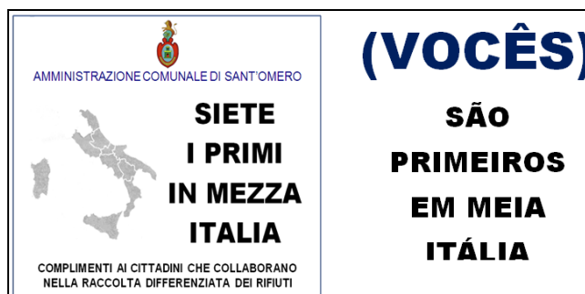
Fig. 4: Folhetos informativos sobre o inicio da Coleta Seletiva