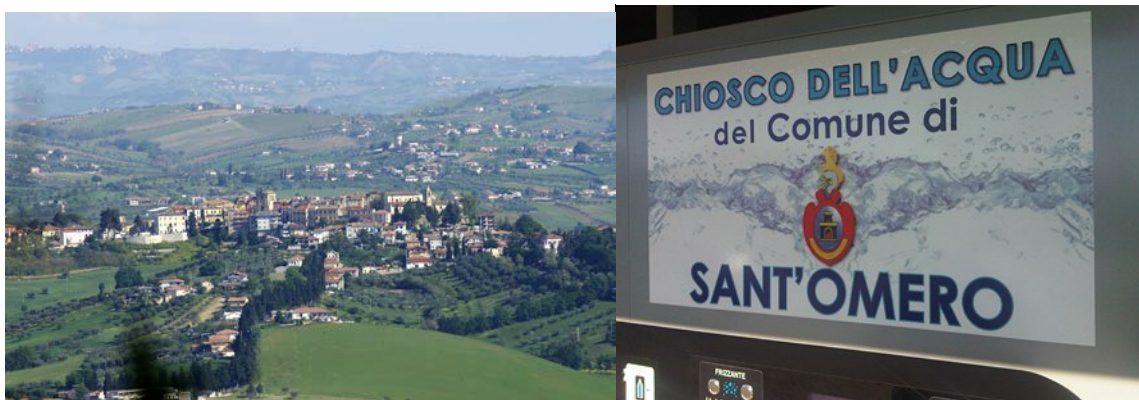
Fig.3: Vista parcial de Sant'Omero /Região de Abruzzo - Itália.

Sant'Omero estende-se por uma área de 33 km 2 , tendo uma densidade populacional de 159 hab/km 2 . Faz fronteira com Bellante, Campli, Civitella del Tronto, Corropoli, Mosciano Sant'Angelo, Nereto, Sant'Egidio alla Vibrata, Torano Nuovo, Tortoreto.