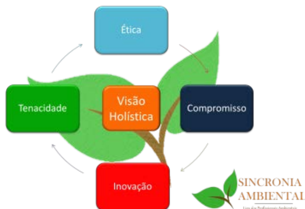
Figura3: Ilustração dos valores da Sincronia Ambiental.

Os princípios continuam os mesmos, sendo a nossa missão “Criar um networking dos gestores ambientais com o intuito de fortalecer a profissão e o profissional”, nossa visão “Ser referência nacional na integração dos gestores ambientais”. Os nossos valores pautam-se na visão holística, conforme figura 3.