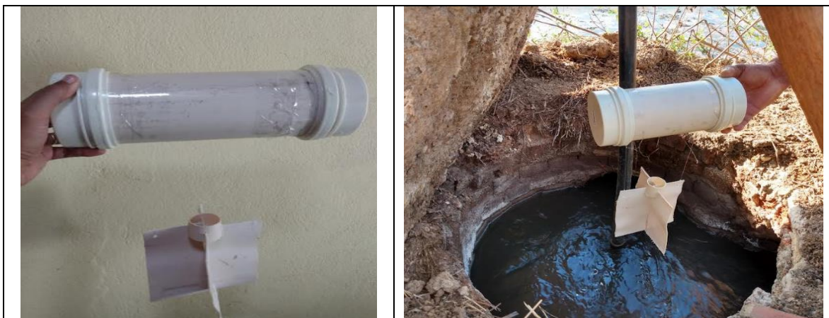
Figura 1: Drogue usado para avaliação da hidrodinâmica na lagoa de polimento.

Os cocos verdes, num total de 20 unidades, foram lançados um a um, suas trajetórias foram acompanhadas visualmente e as localizações registradas em um papel quadriculado. Já o drogue , consistiu de uma “cápsula” de PVC com 30 cm de comprimento e 100 mm de diâmetro, conectada por meio de dois fios a placas (Figura 1). A cápsula funcionou como um flutuador e no seu interior foi colocado um smartphone com o aplicativo STRAVA, para o registro automático do trajeto percorrido durante o período em que permaneceu na lagoa. Com a finalidade de garantir que o aparelho ficasse ligado durante todo o tempo necessário, uma bateria externa foi conectada ao smartphone. O flutuador do drogue foi dimensionado de forma que ficasse com a menor exposição possível ao vento, de forma que houvesse menor influência do mesmo e maior movimentação conforme as linhas de escoamento do líquido.