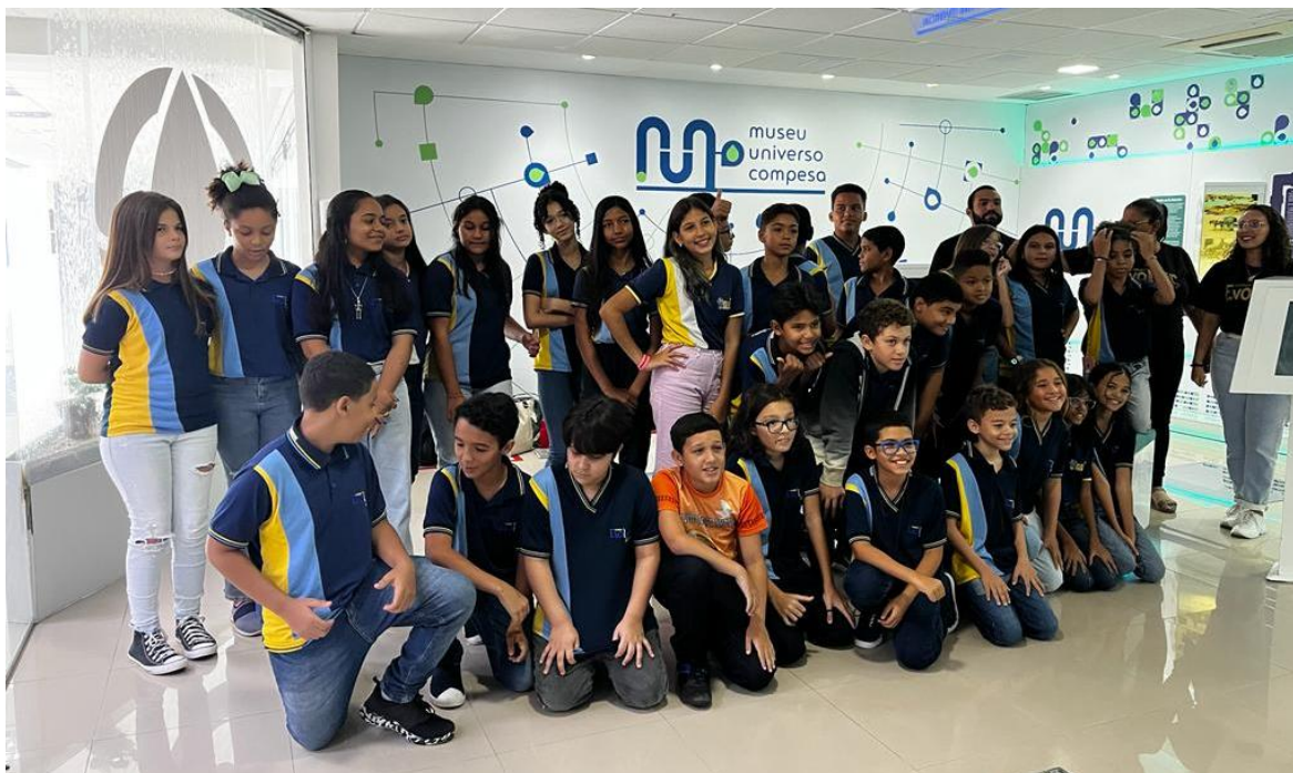
Figura 8: Grupo Fundamental anos finais (6º anos) em uma visita mediada ao Museu Universo Compesa

Os públicos envolvem-se com as atividades propostas, interagindo com os conteúdos e acessando informações para construir novos conhecimentos sobre os temas apresentados. Nossa equipe técnica e nossos especialistas contribuem com a sensibilização dos estudantes sobre a importância das temáticas ambientais para uma sociedade mais sustentável e possibilitam aos educadores tratarem temas transversais importantes na formação de cidadãos responsáveis com o consumo dos recursos naturais.