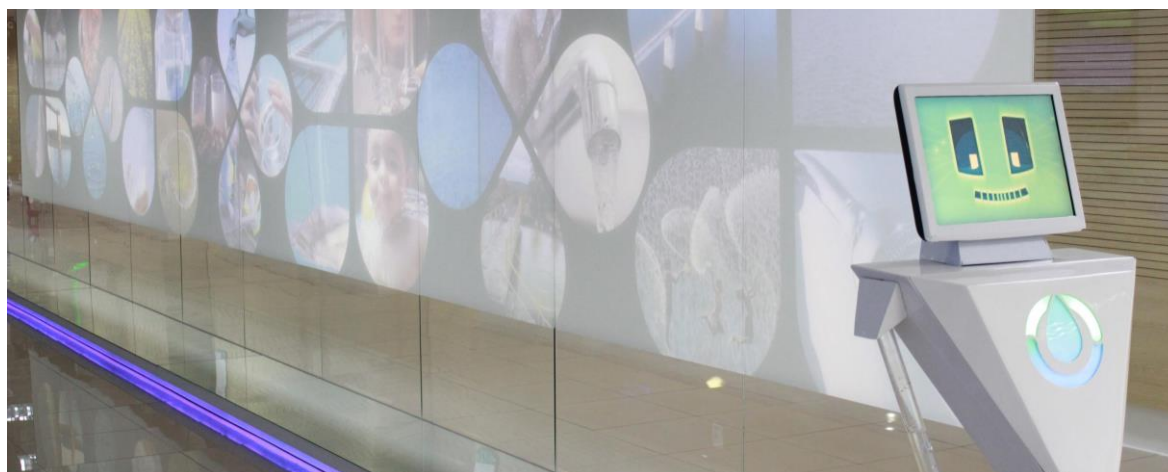
Figura 3: Robô Bio (Biodiversidade) que convida os visitantes a interações através de quiz ambiental.

No espaço do futuro, um telão projeta o mapa do estado para mostrar a dimensão de todos os sistemas de abastecimento de água e de esgotamento sanitário operados pela Compesa, além de um grande painel de vídeo wall exibe os próximos projetos da companhia, informando estatísticas e metas. Ainda no ambiente do “futuro” uma interação inusitada do Museu Universo Compesa é a “Cápsula do Tempo”, que armazena mensagens deixadas pelos visitantes para as gerações futuras e que servem de inspiração para novas ações da empresa. A visita termina com o simpático Robô Bio, que por meio de projeção holográfica, propõe a participação em jogos educativos, sensibilizando o público sobre a responsabilidade de cada um com a sustentabilidade.