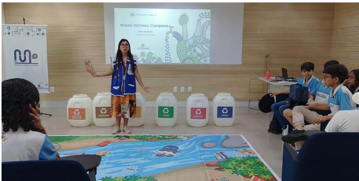
Figura 4: Atividade Pescaria sustentável, jogo de chão com objetivo de trabalhar o descarte correto dos resíduos sólidos através da adoção de práticas de coleta seletiva.

Florzinha, Januário e Papa Lixo, criados para conversar com o público infanto-juvenil sobre temáticas ambientais.