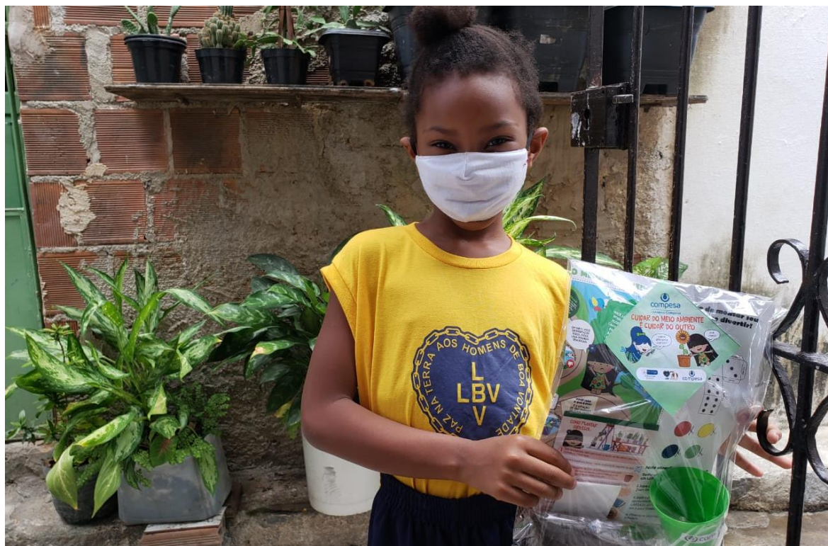
Figura 7: Ação Cuidar do Meio Ambiente é Cuidar do Outro Univesp Compesa e Legião da Boa Vontade - LBV

A maioria do público atendido pelo museu (89,9%) é de origem externa à Compesa. Deste recorte, 41,1% são oriundos de instituições privadas, 35,7% de instituições públicas, 12,6% de outras companhias de saneamento, 4,3% de Organizações não Governamentais e 6,2% de grupos com categoria não definida. Quanto ao nível de escolaridade do público participante das atividades, 31,8% se enquadram no Ensino Fundamental I 19,8% no Ensino Fundamental II, 3,5% no Ensino Superior e 11,6% do Ensino Médio. 28,9% das ações não são categorizadas com base no nível de escolaridade e 4,4% se distribui entre a Educação de Jovens e Adultos, Pós-graduação, Ensino Infantil e Médio Técnico.