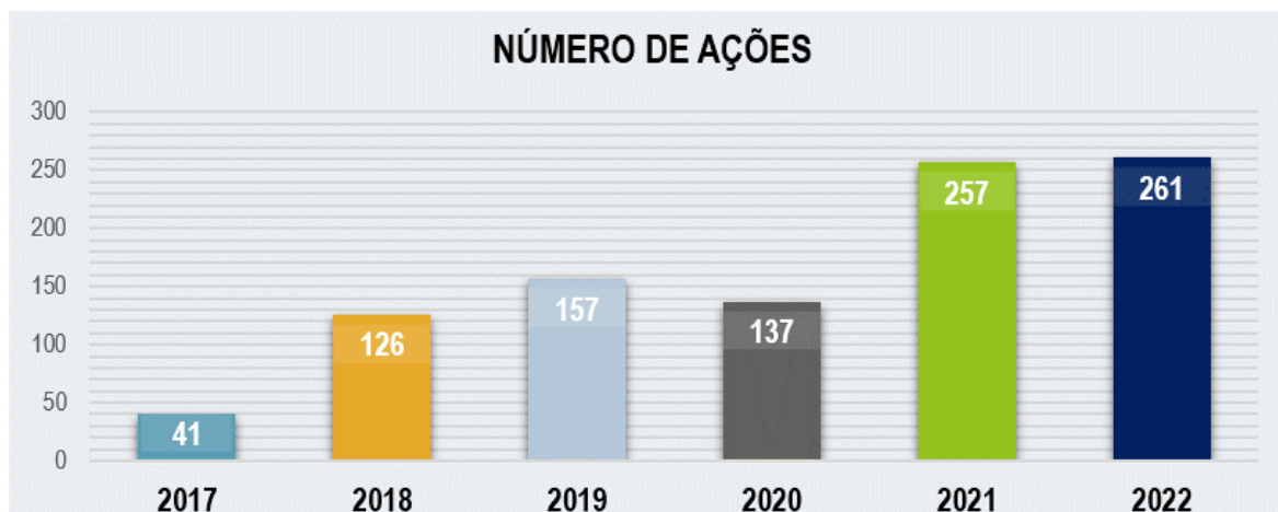
Figura 6: Impacto das atividades do Museu Universo Compesa através do número de ações e alcance do público a cada ano – Período correspondente a junho 2017 à dezembro 2022.

Os números de ações e de alcance do público estão exibidos na imagem abaixo. (Figura 6)