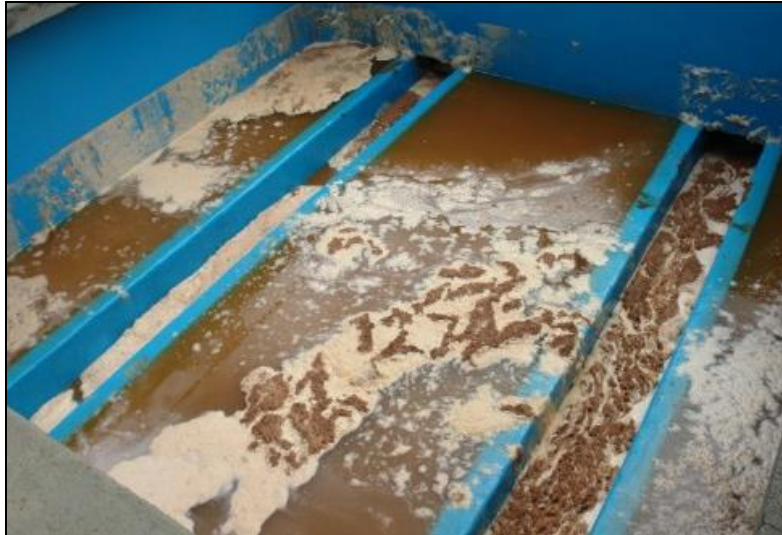
Figura 1: Água de Lavagem de Filtros.

A água de lavagem de filtros (ALF) é considerada uma água residuária que representa até 10% de toda a água produzida em uma ETA. Ela é gerada devido à limpeza dos filtros (Figura 1) e contém impurezas que não foram removidas nos decantadores (ou flotadores), que são retiradas do meio filtrante durante o processo de lavagem (FREITAS, 2010).