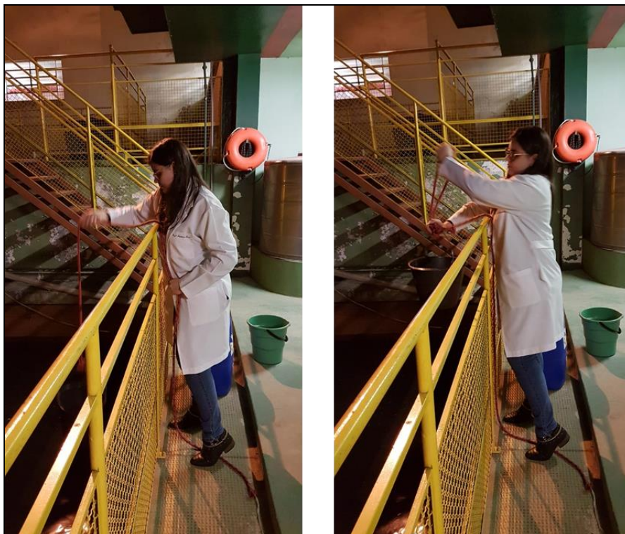
Figura 2: Coleta da água de lavagem de filtros na ETA.

A Figura 2 apresenta a coleta da água de lavagem de filtros na ETA.