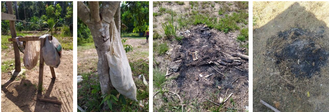
Figura 2: Armazenamento em sacolas plásticas (a); queima inadequada dos resíduos sólidos na aldeia Marawytawa (b). Fonte: Autores (2024)

Observou-se diversos pontos de disposição inadequada de resíduos encontrados no núcleo vilinha (Figura 6), agravada pela falta de informações claras sobre o uso e manutenção das alternativas implantadas, gerando preocupações em relação à saúde da comunidade e proliferação de vetores. Muitos resíduos sólidos são armazenados em sacolas plásticas (Figura 7) e, apesar do núcleo contar com os serviços de coleta e transporte ofertados pela prefeitura municipal de Tucuruí, observou-se diversas áreas de queima inadequada de resíduos na comunidade (Figura 8).