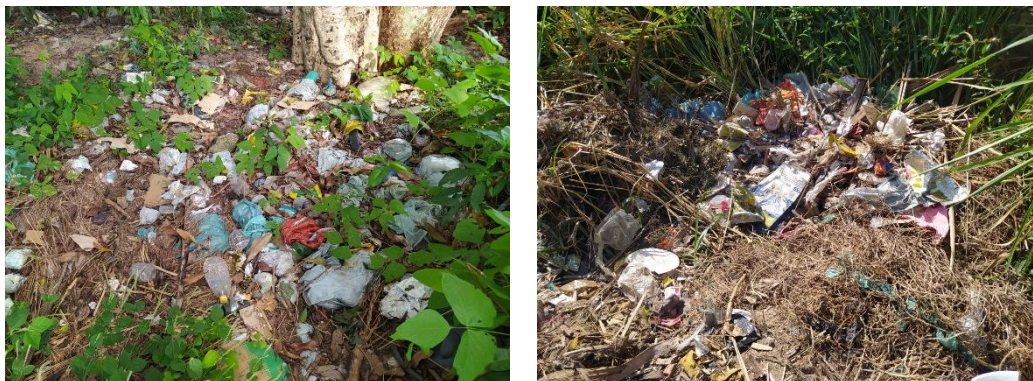
Figura 6: Disposição irregular de resíduos diretamente no solo no núcleo Vilinha - aldeia Trocará

Observou-se diversos pontos de disposição inadequada de resíduos encontrados no núcleo vilinha (Figura 6), agravada pela falta de informações claras sobre o uso e manutenção das alternativas implantadas, gerando preocupações em relação à saúde da comunidade e proliferação de vetores. Muitos resíduos sólidos são armazenados em sacolas plásticas (Figura 7) e, apesar do núcleo contar com os serviços de coleta e transporte ofertados pela prefeitura municipal de Tucuruí, observou-se diversas áreas de queima inadequada de resíduos na comunidade (Figura 8).