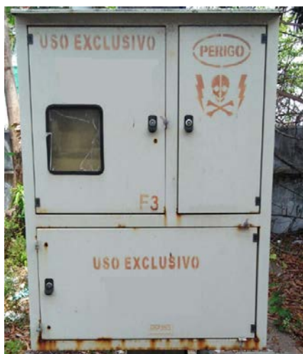
Figura 3: Quadro para a medição convencional binômia

A tabela 2 mostra os novos valores das faturas de energia após a modificação tarifária. Observa-se que do ciclo 05 a 12/2016, foi possível uma economia total de R$ 15.085,19. Em média, a economia mensal foi de R$ 1.885,65, valor muito próximo do que foi simulado. A figura 4 ilustra os valores das faturas de energia simulados e reais para antes e após a modificação tarifária.