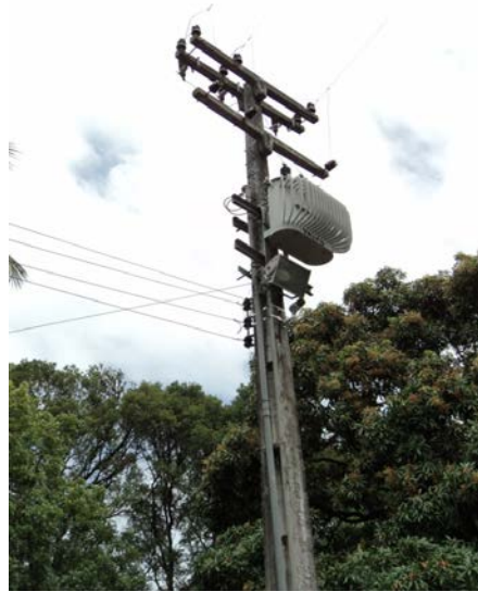
Figura 1: SE de 45 kVA da EEAT Parque Histórico

O simples fato de a unidade já possuir em suas instalações uma subestação (figura 1) já permitiu que fosse solicitada à CELPE a modificação da modalidade tarifária. Entretanto, como a unidade possuía o quadro de medição indicado, conforme norma da CELPE, apenas para a medição monômnia convencional (figura 2), foi necessária a substituição deste.