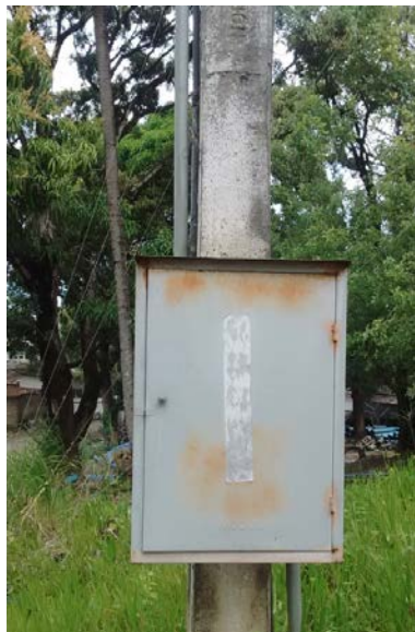
Figura 2: Quadro para a medição convencional monômnia