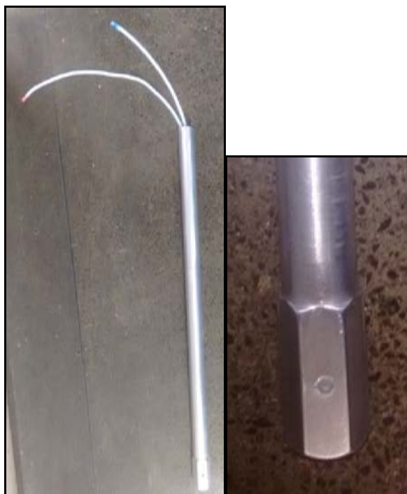
Figura 3 - Protótipo construído e detalhe de uma das faces com a tomada de pressão.

As tomadas de pressão foram posicionadas em faces opostas, acopladas separadamente à duas mangueiras de nylon de 2 mm que passam internamente ao tubo, seguindo até a extremidade superior. A Figura 3 ilustra o protótipo construído.