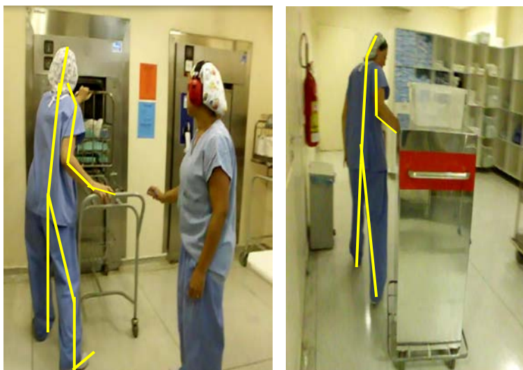
Figura 05 e 06: Postura adotada no processo de esterilização de materiais higienizados vindos do centro cirúrgico.