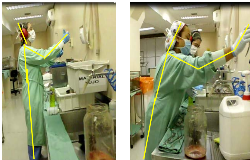
Figura 03 e 04: Postura adotada na lavagem de materiais sujos, vindos do expurgo do centro cirúrgico.

A pontuação encontrada para a postura do pescoço, tronco e pernas, foi igual a 3 tabela 01, a partir dos seguintes valores adotados: Pescoço = 1: flexão > 20°; Tronco = 2: flexão entre 0° e 20°; Pernas (trabalho em pé) = 1: flexão entre 90° e 60°.