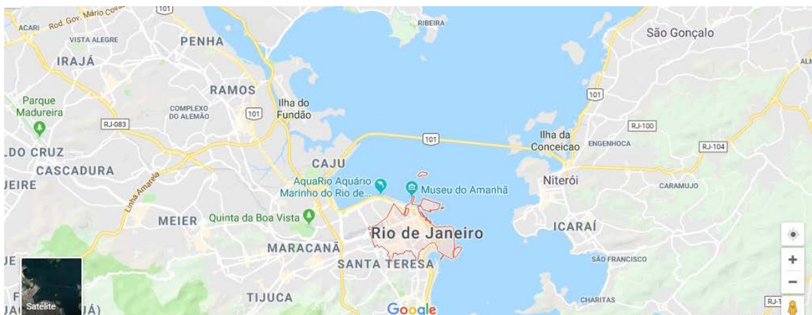
Figura 1 – Croqui da área de análise do trabalho

informações requisitadas pelas autoras, obtendo uma resposta única no universo de 10 empresas questionadas. Desta forma o trabalho desenvolveu-se a partir de informações secundárias obtidas em sites da internet, não tendo sido realizada avaliação quantitativa do sistema e tendo assim como fronteira a avaliação tecnológica geral e análise qualitativa do ciclo de produção das referidas indústrias.