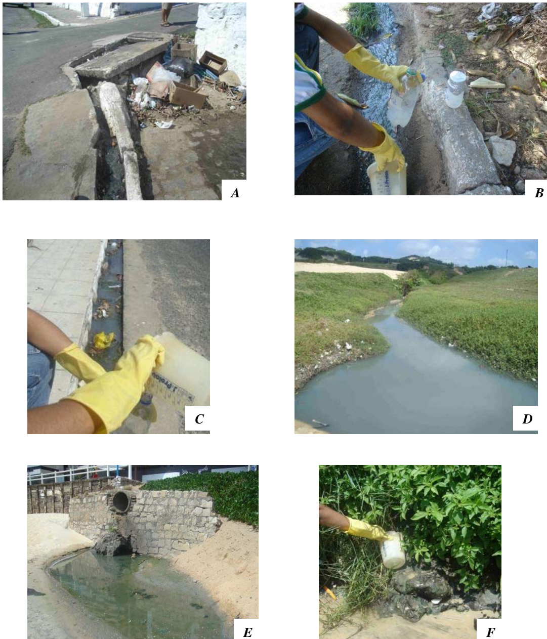
Figura 2 – Locais de coleta de esgotos. A: primeiro ponto (início da Avenida João XXIII); B: segundo ponto (Rua Novo Mundo); C: terceiro ponto (Fim da João XXIII); D: quarto ponto (Praia de Mãe Luiza); E: quinto ponto (Praia de Miami); F: sexto ponto (Praia de Areia Preta).

A DQO foi verificada no mesmo dia das coletas pelo método de refluxação fechada e utilizada para a avaliação do potencial de matéria redutora de uma amostra. Emprega-se, juntamente com a DBO, para observar a biodegradabilidade de despejos. A DBO, que retrata a quantidade de oxigênio requerida para estabilizar, através de processos bioquímicos, a matéria orgânica carbonácea (baseada no carbono orgânico), sendo uma indicação indireta, portanto, do carbono orgânico biodegradável, foi medida pelo método Winkler-azida, sempre no quinto dia após as coletas, utilizando-se temperatura de incubação de 20°C. A medição do nitrogênio amoniacal foi efetivada pelo método colorimétrico (Nessler), e a dos sólidos suspensos, pelo espectrofotométrico. Todos baseados no Standard Methods for the Examination of Water and Wastewater (APHA; AWWA; WEF, 2005), com exceção dos sólidos suspensos que foi pelo Spectrophotometr Handbook Dr/2000 (1991).