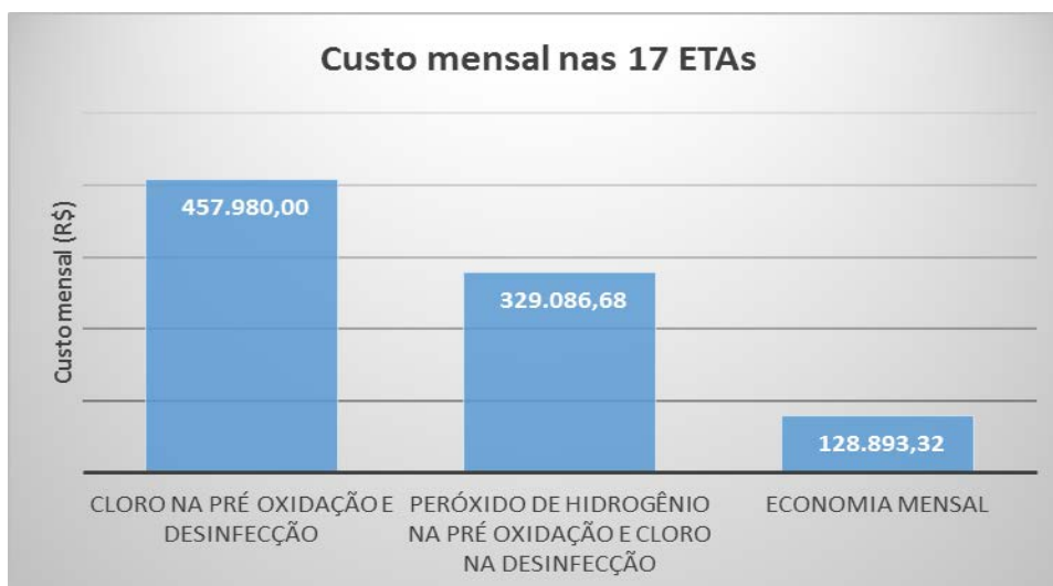
Figura 3: Apresentação do custo e economia mensal

Verifica-se que algumas estações de tratamento de água, a economia é maior que 50 %. A figura 3 apresenta o custo total mensal das 17 unidades operacionais antes (cloro na pré e na desinfecção) e depois (peróxido de hidrogênio na pré e cloro na desinfecção).