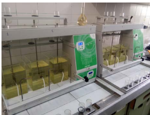
Figura 1: Ensaios com Jar Test, modelo 218-3

a) mistura rápida: tempo de mistura de 10 s, rotação do agitador de 300 rpm e dosagem de sulfato de alumínio fixa em mg/L adotada na Estação de Tratamento; b) floculação: rotação do agitador em rpm por minuto de cada etapa de floculação adotada na Estação de Tratamento; c) decantação: tempo adotado na Estação de Tratamento.