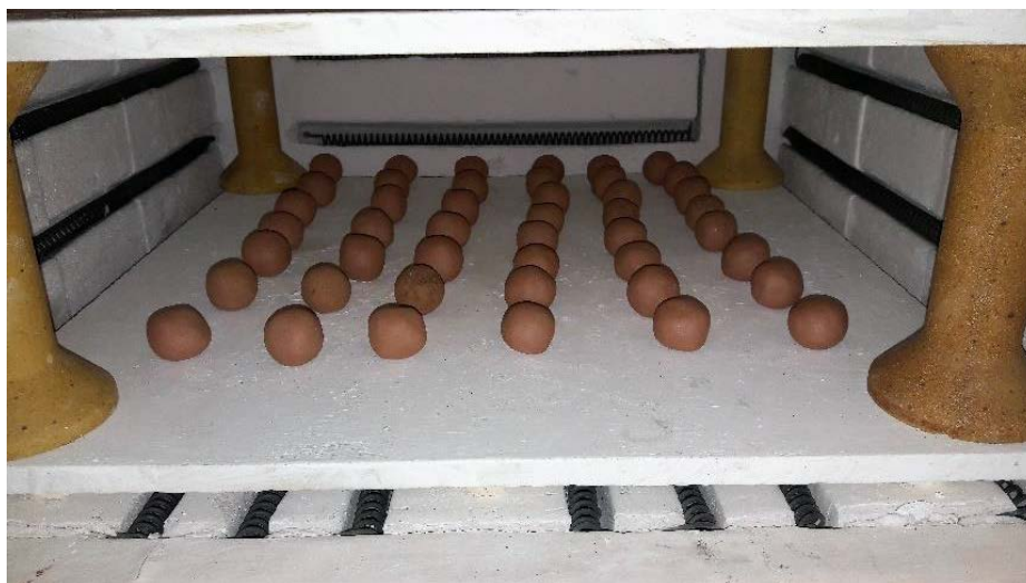
Figura 02: Conjunto de corpos de prova dentro do forno para a queima

Como o lodo já possui uma quantidade de água relevante, não foi preciso incorporar água no processo. Os corpos de prova foram deixados em temperatura de 105°C por 24h seguidos de queima à 1000°C por 10h. A figura 02 ilustra corpos de prova dentro do forno industrial para o processo de queima.