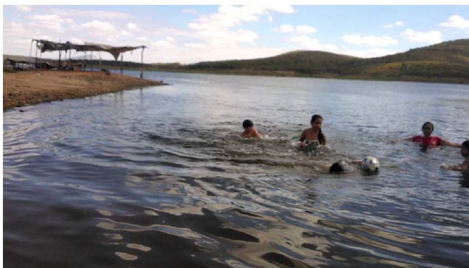
Figura 5 - Recreação no Açude Pedras Brancas