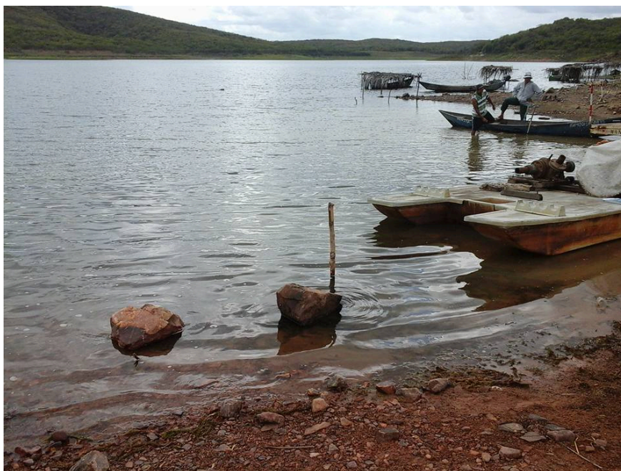
Figura 4 - Pescadores no Açude Pedras Brancas