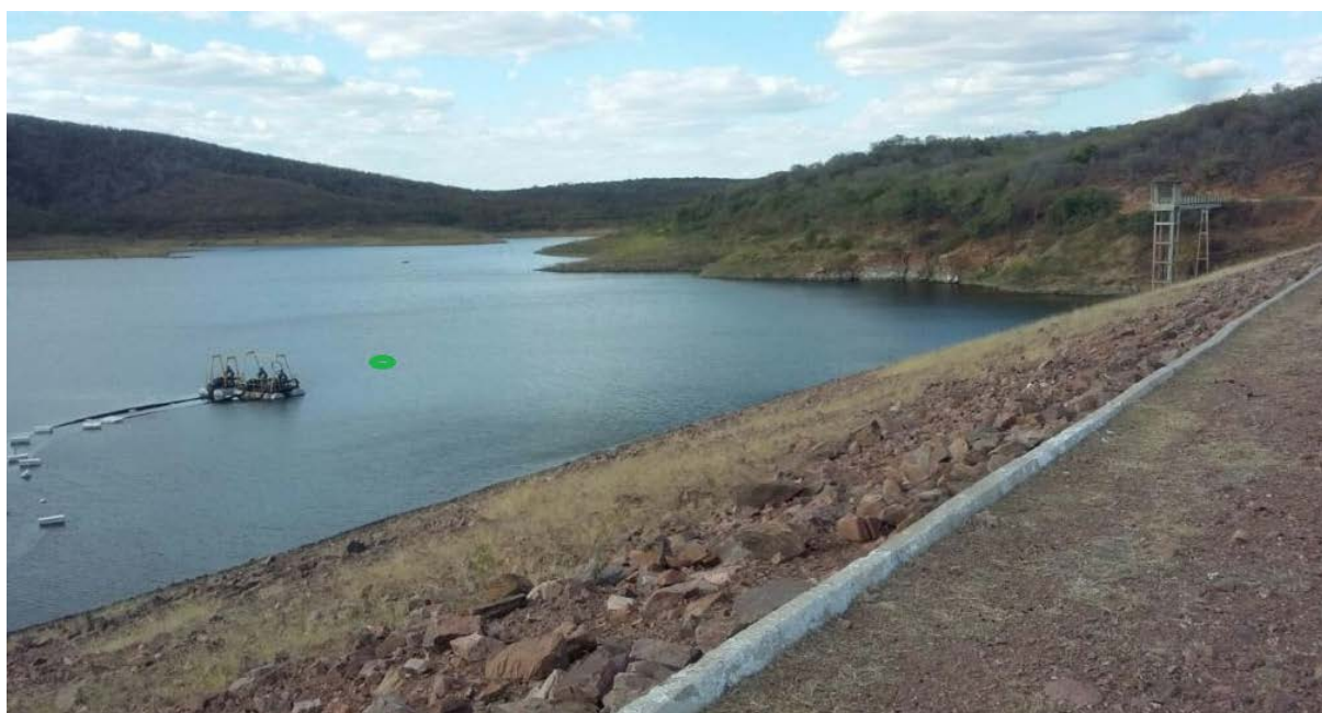
Figura 2 - Foto do reservatório e seu ponto de coleta

A figura 2 representa uma foto retirada de cima do barramento do Açude Pedras Brancas, demonstrando o local do ponto de coleta, bem como o início da adutora construída para abastecer a cidade de Quixeramobim.