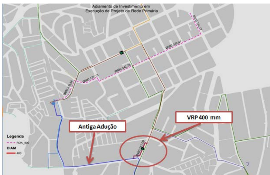
Figura 1 - Prolongamento de 150 m de rede de DN 400 mm, e posterior instalação de válvula redutora automatizada de DN 400 mm, intervenção que possibilitou o adiamento do investimento para o assentamento de rede de reforço de 800 mm.

Outra ação integrada aplicada no projeto foi a avaliação técnica da micromedicação neste setor, através da área de engenharia, onde foram estabelecidos critérios de atuação para substituição de medidores em locais estratégicos, focando os esforços nos pontos onde o resultado esperado era mais expressivo. A aplicação de medidores de moderna tecnologia nestes locais promoveu de imediato o aumento do volume medido através da redução da submedição.