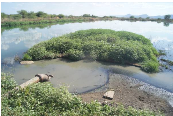
Figura 6 – ETE assoreada e com vegetação no talude interno e dentro da mesma (28/09/2018).