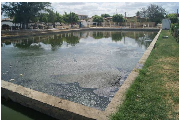
Figura 2 – Proximidade da ETE com núcleo habitacional (05/10/2018).

isolamento físico/cerca, ausência e/ou mau funcionamento dos leitos de secagem de lodo, presença de vegetação no talude interno das lagoas, inclusive algumas com vegetação dentro das mesmas, material sobrenadante, presença de animais no interior da ETE, lagoas assoreadas e disposição final do efluente tratado em curso d'água intermitente ou como reuso sem controle adequado na agricultura. As Figuras 2 a 7 mostram alguns exemplos desses problemas. Além disso, também contribuiu para a redução do IQL a falta de monitoramento dos efluentes bruto e tratado e o não atendimento aos padrões de emissão adotados pelo Órgão ambiental. Vale salientar que nenhuma ETE obteve pontuação em relação à profundidade do lençol freático x permeabilidade natural do solo, sugerindo que o solo adjacente aos sistemas instalados necessariamente indica a necessidade de impermeabilização do fundo das lagoas de estabilização.