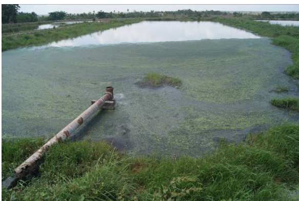
Figura 4 – Presença de material sobrenadante na Lagoa Facultativa (09/10/2018).