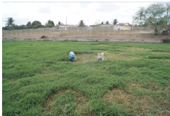
Figura 3 – Cultivo de capim dentro da Lagoa Facultativa (04/10/2018).