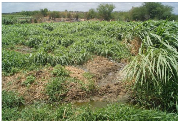
Figura 7 – Reúso do efluente final sem controle adequado na agricultura (27/09/2018).