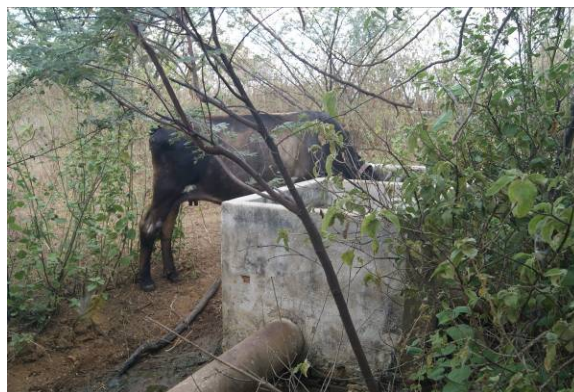
Figura 5 – Presença de animal bebendo efluente final da ETE (27/09/2018).