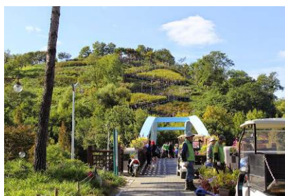
Figura 6 - Parque de Nanjido em 2002

Existem 106 drenos de biogás em toda área, o qual foi utilizado como fonte de energia e aquecedor nas instalações da Copa do Mundo, como também em 40 prédios comerciais e 16.335 residências da área de seu entorno. A recuperação do ecossistema se deu pela sucessão de implantação de espécies vegetais que ajudaram tanta na dissipação da poluição dos solos, ar e água, como também na atração de diversas espécies de aves e outros animais.