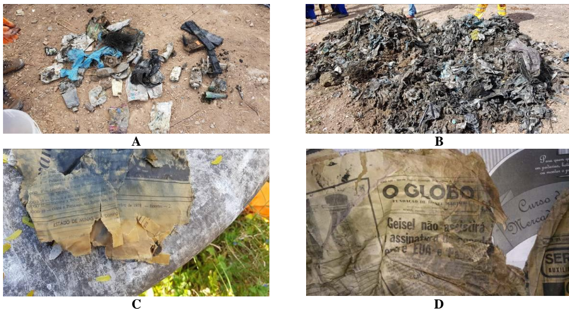
Figura 1 – Resíduos escavados em antiga área de disposição final de RSU em Belo Horizonte/MG

Para tanto, deve-se fazer um planejamento de longo prazo, para que essas áreas venham a ser convertidas, de forma paulatina, em parques.