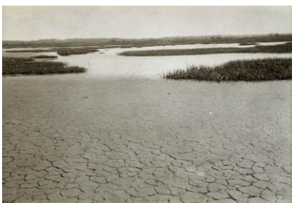
Figura 2 - Área determinada para a construção do Aterro de Fresh Kills na década de 1930.

Com a elevada demanda devido a grande produção de resíduos pela Região Metropolitana de Nova Iorque, o aterro de Fresh Kills tornou-se o principal local de disposição de todos os resíduos (Figura 3), e seu funcionamento, que foi planejado até meados dos anos 70, foi prorrogado até o ano de 2001, data em que foi oficialmente fechado pela United States Environmental Protection Agency (USEPA).