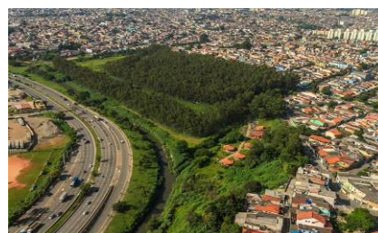
Figura 13 - Parque Jardim Primavera