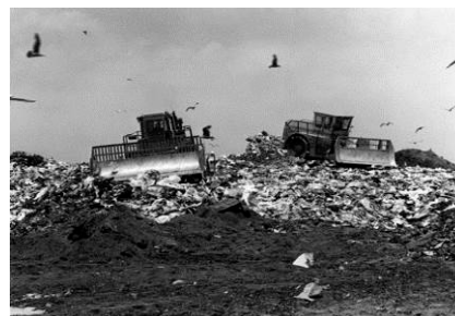
Figura 3: Aterro de Fresh Kills em seu máximo de operação na década de 70.