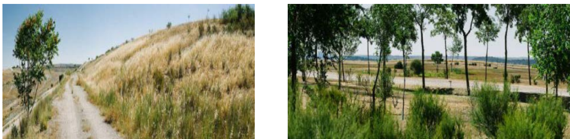
Figura 7 – Aterro de Valdemingómez – Madrid (Espanha)

O aterro sanitário de Valdemingómez (Figura 7) está situado a cerca de 20 km de distância do centro urbano da cidade de Madrid, capital da Espanha, e estende-se sobre uma área de 100 ha. O tempo de funcionamento desse aterro foi de 20 anos, sendo suas atividades encerradas no ano de 2000. Este aterro atendia a região metropolitana de Madrid e as cidades de Rivas e Arganda del Rey , sendo que essas comunidades geravam aproximadamente 3.000 t/d de resíduos (Pereira e Mañas, 2001). Atualmente, está em fase de transição para ser transformado em parque público.