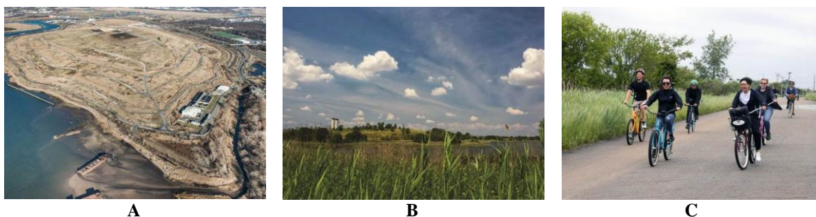
Figura 4: Fresh kills Park em operação quando funcionava como aterro (A) e área do parque em 2016 (B) e 2018 (C).

Logo que a execução do plano se procedeu, as áreas da região na qual não havia resíduos dispostos foram adaptadas para sua transformação em parque e área de lazer, como mostra a Figura 4, e ao longo da estabilização correta de cada célula do aterro, essas áreas foram sendo transformadas e anexadas às áreas já em funcionamento como parque. Todo o processo do projeto se dá ao mesmo tempo em que o parque funciona e tem áreas abertas ao público.