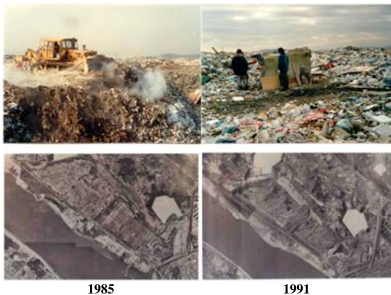
Figura 5 - Aterro Sanitário de Nanjido em funcionamento