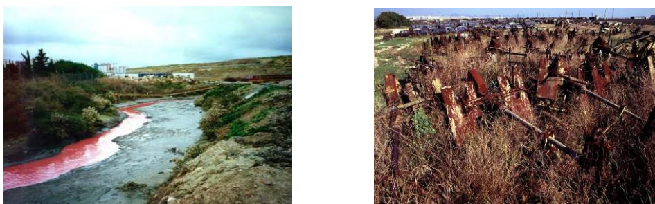
Figura 10 – Complexo antigo do parque das nações

O complexo do Parque das Nações em Lisboa foi realizado através de um projeto de requalificação urbanística e ambiental de uma área de aproximadamente 340 hectares, em uma região ocupada por grandes infraestruturas industriais geradoras de passivos ambientais, como as refinarias de petróleo, docas, matadouro industrial, depósito geral de material de guerra, estação de tratamento de águas residuais, estação de tratamento de resíduos sólidos de Beirolas e um aterro sanitário (Figura 10). O projeto foi viabilizado pela realização da Expo 98 que decorreu em Lisboa, favorecendo a requalificação da área do parque.