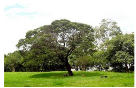
Figura 12 - Parque Raposo Tavares (antes e após a recuperação)

Já o Parque Jardim Primavera, na Vila Jacuí (zona leste), com 122.000 m 2 (Figura 13), foi construído sobre o antigo Aterro Sanitário do Jacuí, situado no entorno do Córrego do Limoeiro com Córrego do Jacuí, no bairro de Ermelino Matarazzo. O Aterro foi desativado em 1989 e a primeira fase de implantação do parque foi concluída em 2012.