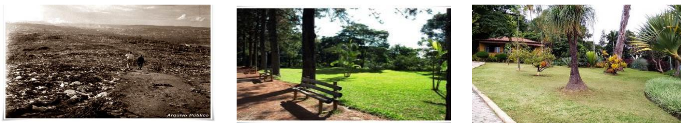
Figura 14 – Parque Jacques Cousteau – Belo Horizonte/MG