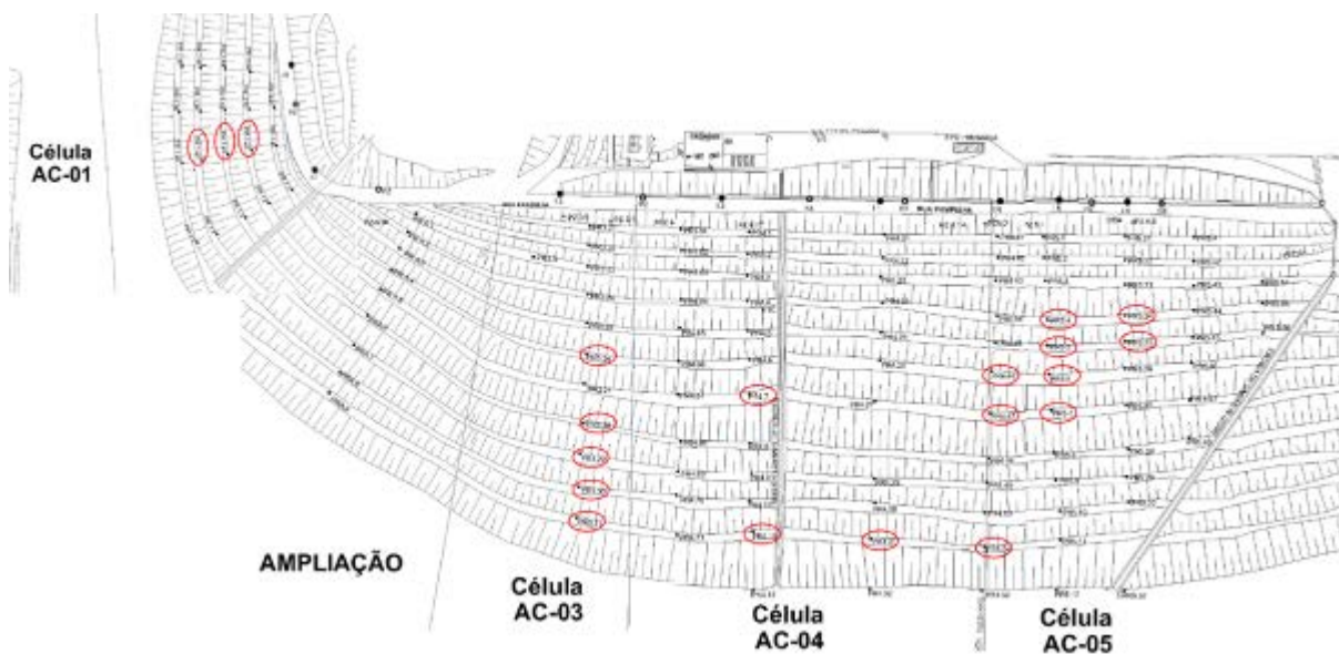
Figura 3 – Localização dos medidores de recalques analisados

Os resultados apresentados e discutidos a seguir referem-se à análise de dados do monitoramento realizado no aterro sanitário de Belo Horizonte, a partir de dados históricos de recalques observados nas células desse aterro. Os resultados se referem somente às leituras de alguns medidores, cujos resultados se mostraram mais significativos em quantidade de leituras e deformações observadas. De um total de 130 medidores existentes, foram analisados 86 medidores (denominados PRs), sendo que, destes, foram selecionados 21 medidores: três na Célula AC-01, cinco na célula AC-03, seis na célula AC-04 e sete da célula AC-05, cuja localização é apresentada na Figura 3.