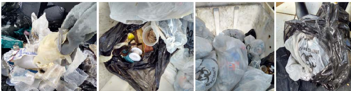
Figura 1 - Descarte inadequado e fora das determinações das RDCs e Resoluções pertinentes – HRT/PA.

Em meio a segregação observou-se certas atitudes que contribuem significativamente para os riscos de doenças e são práticas típicas que colaboram para a ineficiência no gerenciamento de resíduos de serviços de saúde em unidades hospitalares, como por exemplo o acondicionamento de resíduos comuns junto aos resíduos infectantes, bem como destinação inadequada de resíduos pertencentes a classes de riscos diferentes (Figura 1), abaixo.