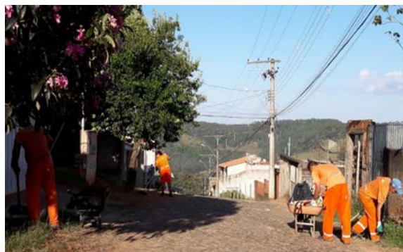
Figura 4: Realização de mutirões de varrição em Viçosa.

Para a definição da estrutura dos serviços de varrição a ser empregada no município foi construído um banco de dados, no qual todas as ruas existentes de Viçosa foram identificadas: i) por nome; ii) tipo de pavimentação; iii) bairro; (iv) setor de varrição; (v) setor/rota de coleta; (vi) frequência de coleta e (vii) horário da coleta. Cada via foi classificada de acordo com: (viii) a sua importância na sua região circunvizinha em via principal ou secundária, considerando-se a intensidade de tráfego de pedestres e veículos, concentração de estabelecimentos comerciais, educacionais e públicos e se a via constituía um acesso importante para a área. Baseado nestes dados, foram definidas a (ix) frequência de varrição e o (x) tipo de varrição para cada via existente.