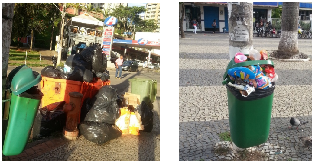
Figura 5: Situação de superlotação dos contêineres e cestos de resíduos existentes na área central da cidade

Um aspecto relacionado aos serviços de limpeza urbana e que afeta diretamente a qualidade dos serviços de varrição realizados é a estrutura dos serviços de coleta. A coleta de resíduos domiciliares e de transeuntes nas vias públicas, em vários pontos da cidade está estruturada para a disposição dos resíduos gerados em contêineres e cestos coletores, distribuídos em diversos pontos da cidade. Contudo, observa-se que o número de contêineres e cestos é insuficiente em relação à quantidade de resíduos gerados, causando situações de exposição dos resíduos nas vias públicas, comprometendo os trabalhos de varrição. Esta situação é ilustrada nas fotos da Figura 5.