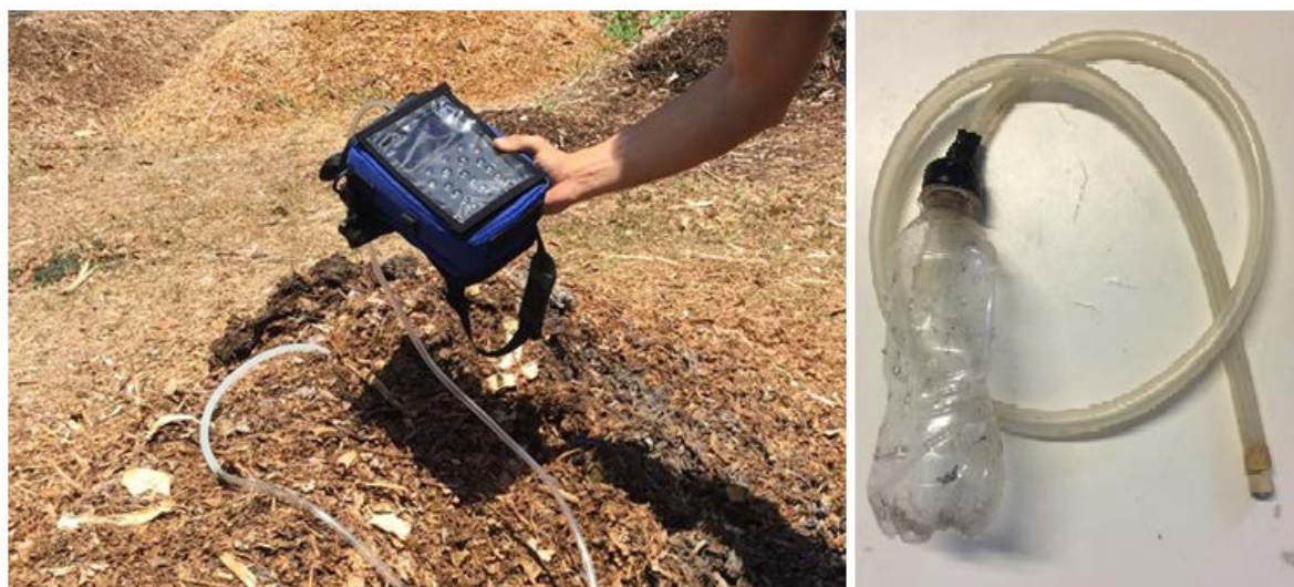
Figura 1- Medição dos gases e sistema de drenagem para leira E100

As leituras dos gases para a leira E100 foram realizadas duas vezes por semana durante os 90 dias iniciais com a utilização do equipamento GEM 5000. Em dois pontos da leira, a uma altura de 0,50m, foram inseridos sistemas de drenagem dos gases com recipientes de polietileno tereftalato, com aberturas em sua superfície, com 2 milímetros de diâmetro. A tampa do recipiente foi conectada ao tubo de silicone com 0,90m de comprimento. Uma rolha de vedação foi encaixada no final do tubo de forma que o gás não escapasse. A cada medição, a rolha era retirada durante a aferição da composição dos gases, que durava aproximadamente 5 minutos, e encaixada novamente após a medição. A Figura 1 apresenta o momento da medição e o sistema de drenagem dos gases.