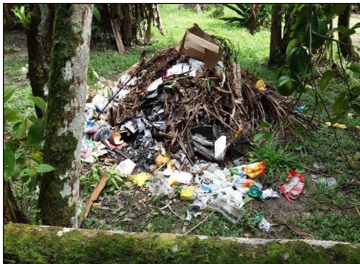
Figura 4 - Descarte de resíduos para queima

afirmaram acondicionar o resíduo para posterior coleta pela prefeitura, tal quantitativo quando comparado com o número de pessoas que responderam que há coleta de resíduos torna-se contraditório, porém, tal situação deve-se ao fato que essas pessoas abrangidas pelo serviço da prefeitura nem sempre esperam a coleta, acabando por assim queimando o resíduo; 3,0% (4 pessoas) responderam queimar, e quando não é possível queimar, descartam em local a céu aberto.