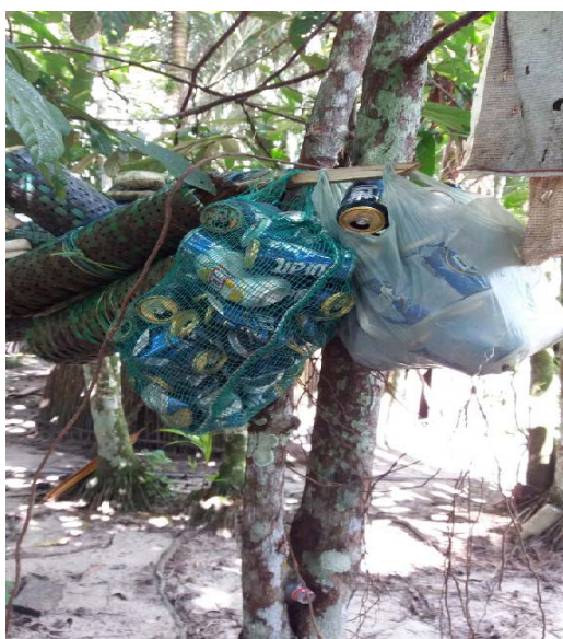
Figura 5 – Separação de latinhas para venda

Dos moradores que afirmaram separar os materiais 63,0% deles (40 moradores), separam apenas latinhas para posterior venda (Figura 5), 28,0% dos moradores (18 pessoas) separam latinhas e garrafas PET, 6,0% (4 pessoas) apenas PET, que servem de vasilhames para guardar o tucupi que os mesmos comercializam, enquanto que outros 3,0% dos moradores (2 pessoas) separam latinhas, garrafas PET e papel/papelão. Nenhum dos entrevistados respondeu separar apenas papel/papelão.