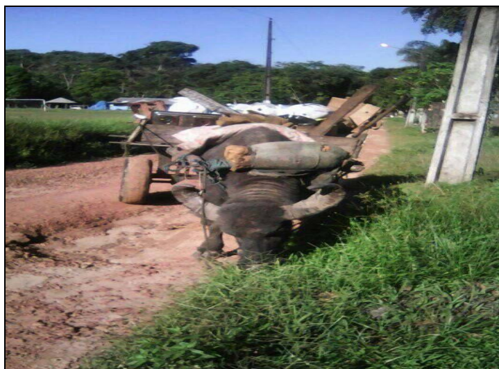
Figura 3– Coleta de resíduos domiciliares por tração animal na comunidade Fazenda

No que diz respeito a cobertura do serviço de coleta e manejo de resíduos sólidos domiciliares, 86,0% dos entrevistados (107 pessoas) responderam que não há coleta de resíduos, e apenas 14,0% (17 moradores) responderam que há, neste último caso, esse quantitativo corresponde a duas comunidades (Itajurá e Fazenda) das 13 abrangidas na aplicação dos questionários. A comunidade Itajurá fica próximo a PA 238, por isso recebe a coleta pela prefeitura, já na localidade Fazenda a coleta é realizada por tração animal (Figura 3).