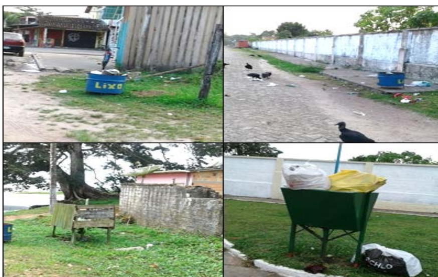
Figura 2- Pontos de acondicionamento temporário de resíduos sólidos domiciliares na cidade de Colares.

No que tange ao serviço de coleta e manejo dos RSU na zona urbana de Colares observou-se que ele é regular e de acordo com as informações fornecidas, durante o período desta pesquisa, pela Secretaria de Meio Ambiente do município (SEMMA), abrange todos os setores da cidade. Existem cestas de lixo distribuídas por vários pontos da cidade, principalmente na área comercial, com o intuito de acondicionar temporariamente os resíduos (Figura 2).