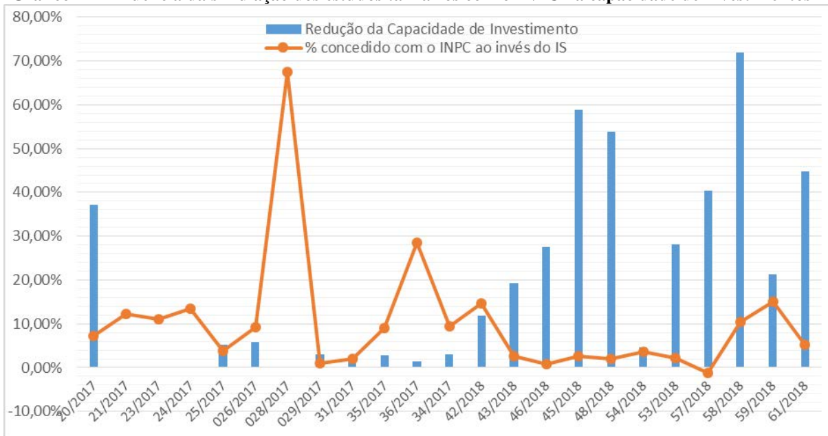
Gráfico 2 – Influência da simulação dos estudos tarifários com o INPC na capacidade de investimentos