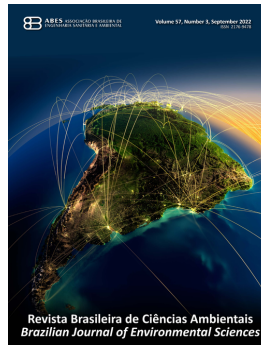
ABES BRASIL REVISTA DE CIÊNCIAS AMBIENTAIS