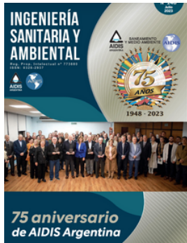
AIDIS ARGENTINA REVISTA ISA