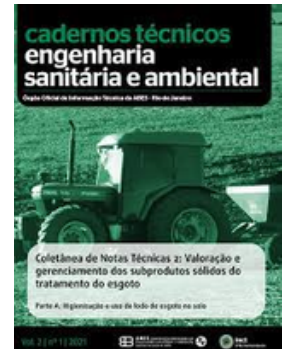
ABES BRASIL REVISTA DE BIO